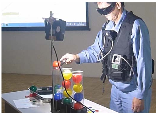
光源、照度計を用いた疑似被ばく体験