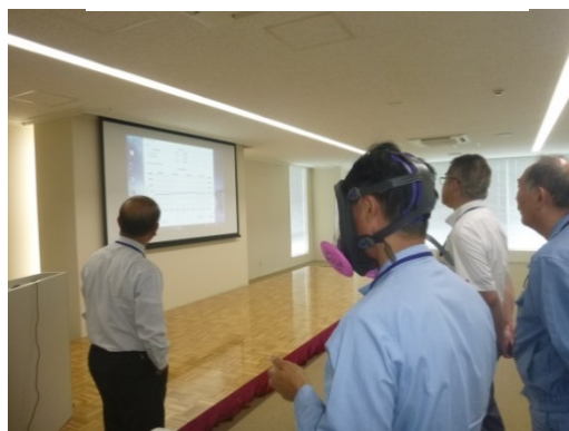
マスクリークテスト体験