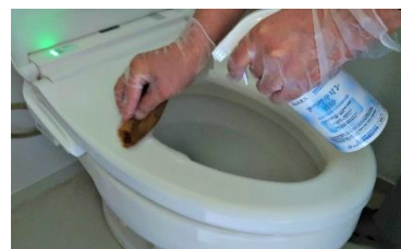
トイレ便座の除染