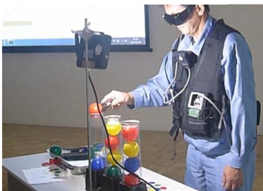
光源、照度計を用いた疑似被ばく体験