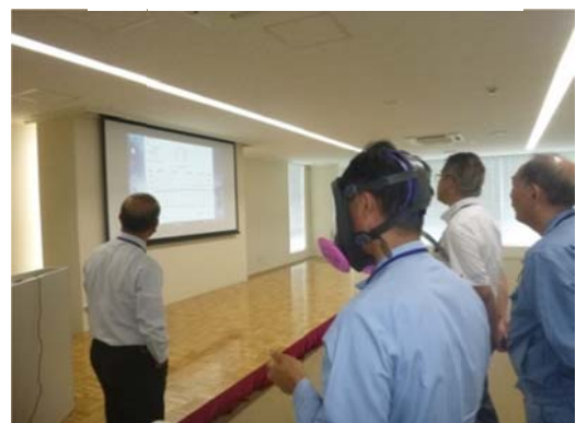
マスクリークテスト体験