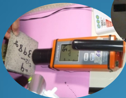
γ線、β線の遮へい実験