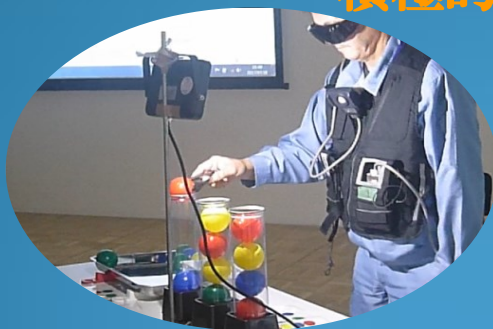
光源、照度計を線源、線量計に見立てた 疑似被ばく体験※